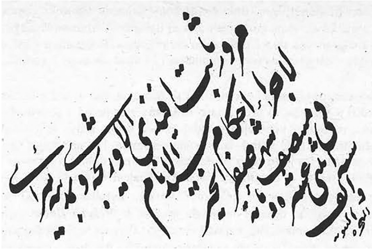
Bilješka iz 1112/1700. godine o dolasku Sabit-efendije u Sarajevo

Prije dolaska u Sarajevo bio je muftija u Tekfurdagu (Tekirdağ). Na mjestu bosanskog kadije ostao je do muharrema 1114 /juni 1702. godine, nakon čega je premješten na dužnost kadije u Konji. 111