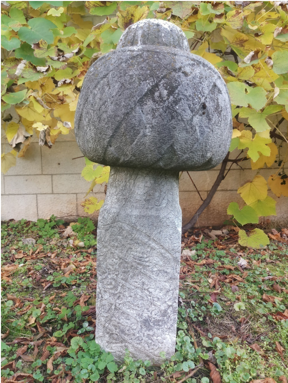
Slika 2: Nišan sarajevskog mule Šejhzadea es-sejjid Muhameda Seid-efendije u haremu Careve džamije u Sarajevu.