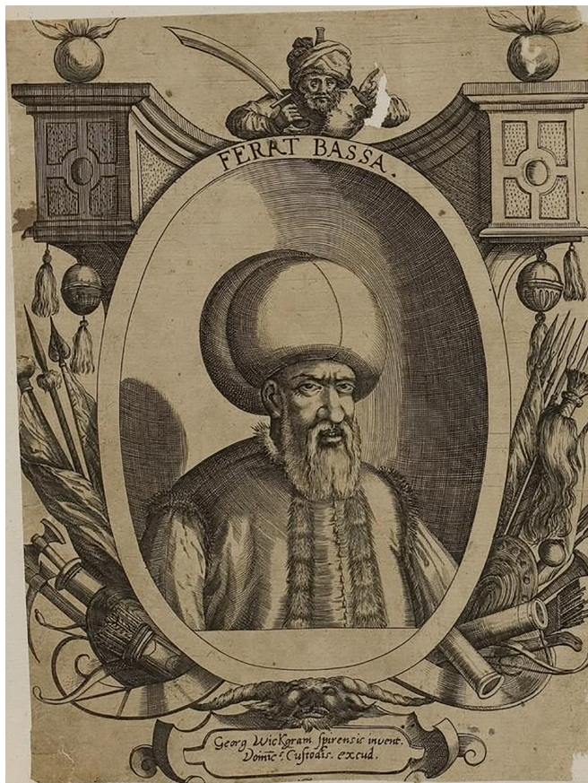
(sl. 4) Dominicus Custos i Georg Wickgram, Portret Ferhad-paše Sokolovića , bakrorez, 197x143 mm, 1566./1590. Germanski Nacionalni muzej, Nirnberg, grafička kolekcija, K 9948

Ovaj tuđinac od Turaka dva puta izabran za vojskovođu protiv Perzijanaca neprijatelja, ništa nije postigao vrlinom, a nešto je mogao prijevarom. Naime, zbog FERHATOVE prijevare, vojskovođa Perzijanac, kraljevski potomak, sâm se uplašio nepoštenja svojega građanina. Misliš li, dakle, da se Ferhat vodio ovom vrlinom, kojom se vodio kao vojskovođa poslan u Hungariju?