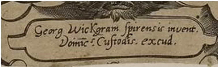
(sl. 2) Georg Wickram spirensis invent. Domic(s). Custodis. excud Georg Wickram Spirski 44 osmislio, Dominicus Custos izradio

Kako vidimo i čitamo iz samog natpisa na grafičkom listu (lat. inventor; oris m. izumitelj, pronalazač, začetnik), kompoziciju je osmislio Georg Wickgram Spirensis, iz drevnoga carskog grada Speyer u Njemačkoj, što je jasno iz njegova pridjevka (sl. 2). Također, iz istog natpisa čitamo da ju je izradio Dominicus Custos (lat. exc. , excud. , excudit : otisnuo). Potonja kratica obično se nalazi na grafičkome listu uz tiskarovu signaturu.