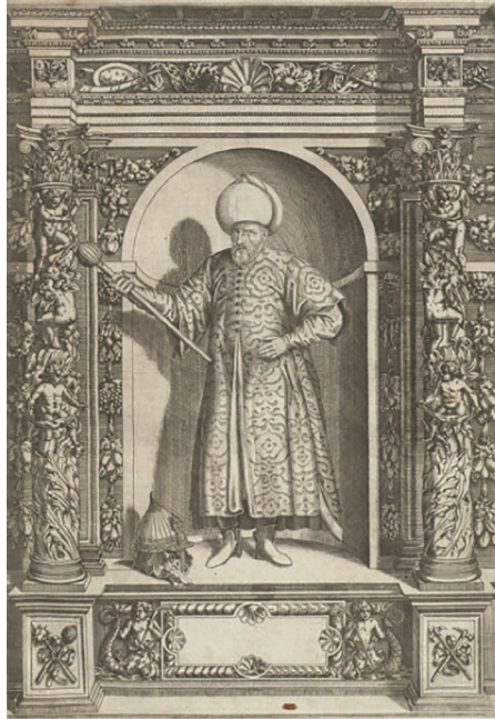
(sl. 1) Dominicus Custos i Giovanni Battista Fontana, Portret Mehmed-paše Sokolovića, 1603. 4

Ertzhertzen 2 s početka XVII stoljeća. Čini se zanimljivim spomenuti da je u junu iste godine Christie's, druga svjetski poznata aukcijska kuća, u Njujorku ponudila i prodala za 10.000,00 $ (8.315,00 €) spomenutu knjigu Der Aller Durchlechtigsten [...] u cjelini . 3 Sa željom da Sotheby's i Christie's nastave uspješno poslovati ovdje se nećemo dalje zadržavati na aukcijama, nego će se nastojati utvrditi vjerodostojnost portreta velikog vezira Mehmed-paše Sokolovića.