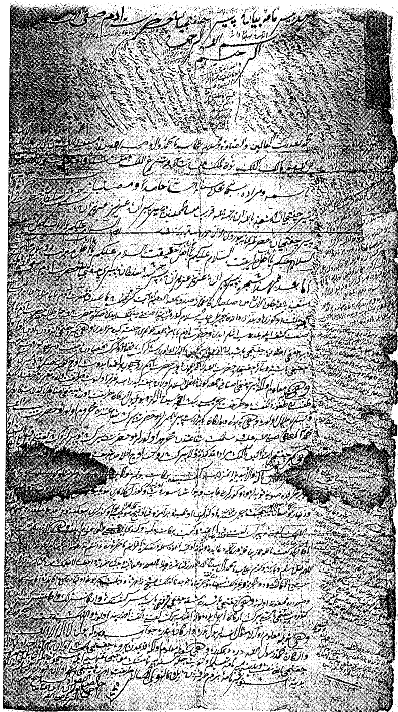
Pirnama čifčija iz 1235./1819. GHB, inv. br. 4170.